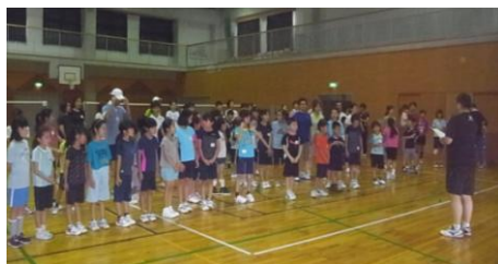
ファミリーバドミントンの様子

未経験の方も大歓迎、ラケットもお貸しします。もちろん経験者も中高生もOK! ★気軽に遊びに来てください。