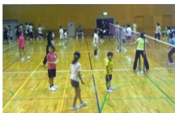
「ファミリーバドミントン」 昨年のようなす